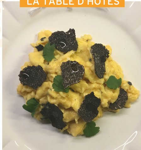
Brouillade d'œufs bio du Luberon au diamant noir de Gordes